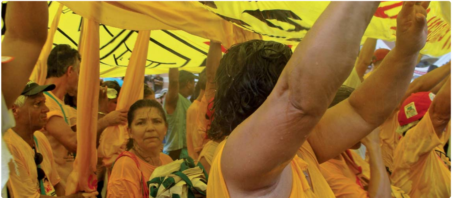
Forum Social Mondial 2009 à Belém du Para