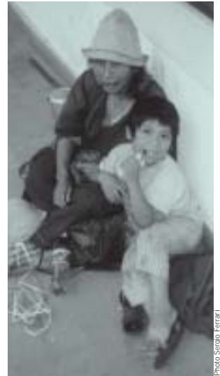
Bolivie: le visage indien

En trois ans, la protestation a parcouru un long chemin: de la rébellion localisée dans une ville d'un demi-million d'habitants, et pour une demande spécifique, jusqu'à une guerre civile qui a commencé par la défense du patrimoine mais a débouché sur l'exigence de la démission du président et surtout un tournant politique et économique complet. Elle a passé de la scène locale à l'échelle nationale, des demandes ponctuelles à des demandes politiques générales, des acteurs municipaux à des acteurs régionaux, d'abord, pour déboucher ensuite sur la formation d'un vaste spectre d'alliances sociales: bien au-delà des positions de ses dirigeants, cette alliance regroupe aujourd'hui les paysans, les travailleurs du secteur informel, et maintenant aussi l'association patronale qui exige la démission du président.