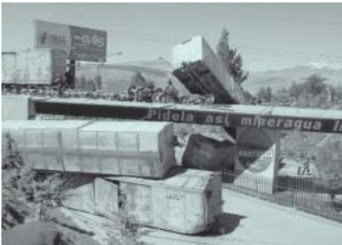
"Bloqueo" sur la route El Alto - La Paz, octobre 2003

Les élections de juin 2000 permirent à cette force sociale d'obtenir une importante représentation dans les institutions étatiques. Les deux fronts qui se présentaient aux élections - le Mouvement pour le socialisme, d'Evo Morales, et Pachakutik, de Quispe - ont obtenu 25% des votes et ont presque réussi à obtenir la présidence, face au candidat de l'ambassade des Etats-Unis, Sanchez de Lozada.