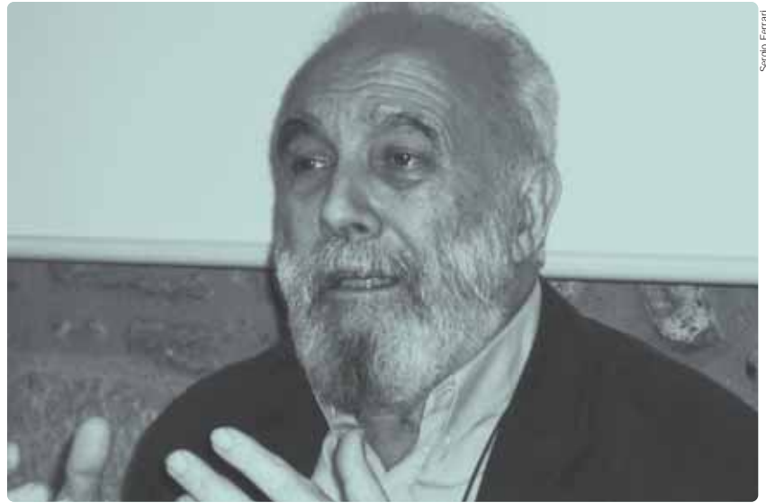
Francisco «Chico» Whitaker

En janvier 2007, le Forum Social Mondial (FSM) se réunira pour sa sixième édition à Nairobi, Kenya. Entretien avec Francisco «Chico» Whitaker, militant social brésilien et l'un des huit co-fondateurs du FSM pendant sa visite à Berne et Fribourg organisée par E-CHANGER en novembre dernier. Whitaker a été couronné du Prix Nobel alternatif 2006 qu'il recevra en décembre à Stockholm.