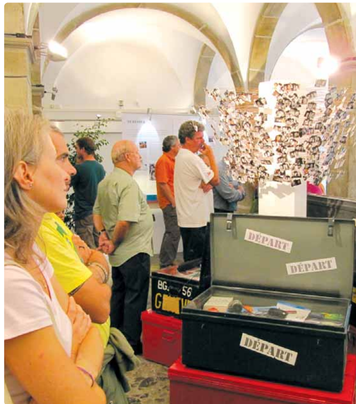
Expo 50 ème à Lausanne