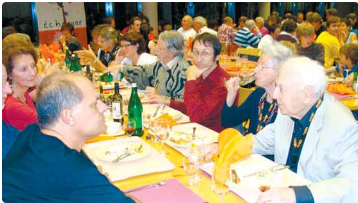
Fête du 50 ème à Fribourg