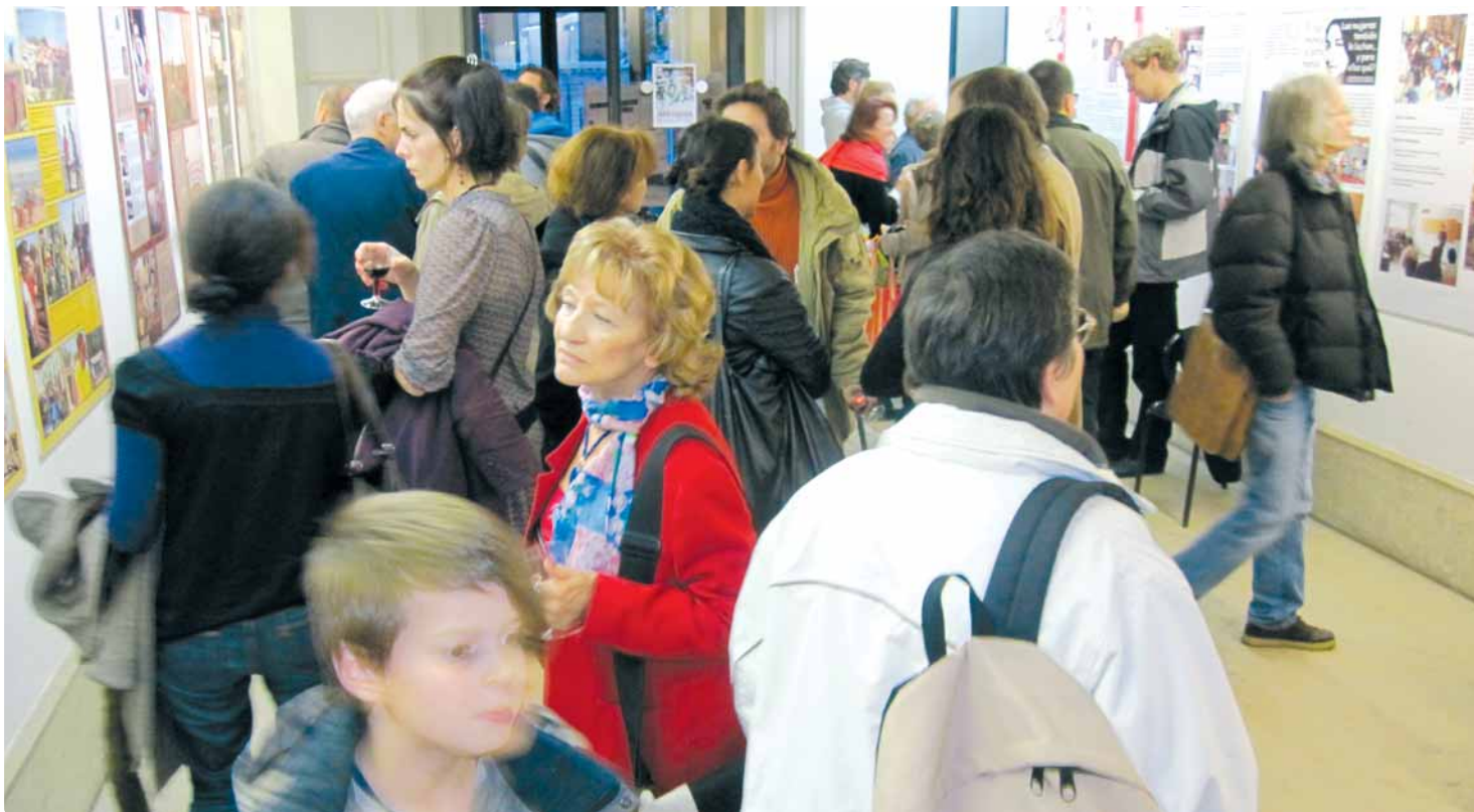
Exposition des Groupes de soutien de coopér-acteurs genevois à la Maison des arts du Grütli à Genève. Fin du 50 ème .