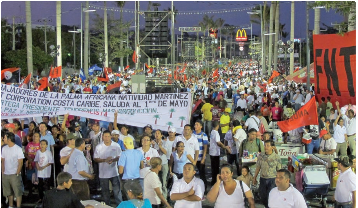
Manifestation à Managua, Nicaragua, 1 er mai 2011

internationale; comme ceux-ci tendent à se réduire dans ces trois pays, elles se trouvent face à des défis croissants de durabilité.