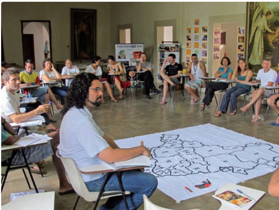
Rencontre des Coopér-acteurs au Brésil, mai 2011

D'autre part, se mettent en place des stratégies de développement économique rapide, basé sur des mégaprojets peu respectueux de l'environnement et des populations affectées (ex. extractivisme et hydrocarbures en Bolivie, plan d'accélération de la croissance et hydro-électricité au Brésil). Ces choix rapportent certes à l'État d'importantes rentrées fiscales, permettant notamment le financement des politiques sociales, mais bénéficient surtout au pouvoir économique en place et au capital international. Ils se réalisent au détriment de projets productifs (agro-écologie, économie sociale et solidaire) renforçant le tissu économique national, mais plus longs et difficiles à mettre en œuvre.