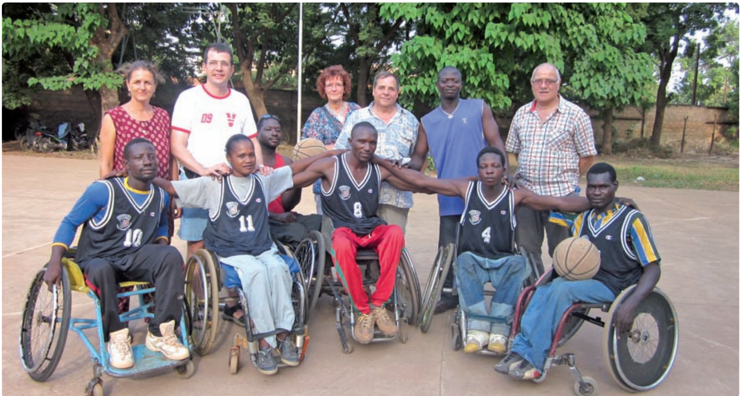
Visite de l'Association St-Camille au Burkina Faso

dans ces sociétés fragiles. Les projets des volontaires de E-CHANGER se termineront ces prochaines années, avec l'espoir d'avoir amélioré durablement, grâce au travail admirable des partenaires locaux, la vie quotidienne des personnes handicapées.