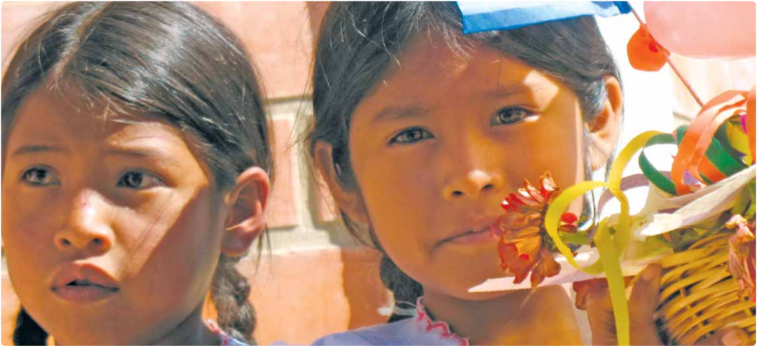
Enfants de l'école Creciendo, partenaire de E-CHANGER en Bolivie