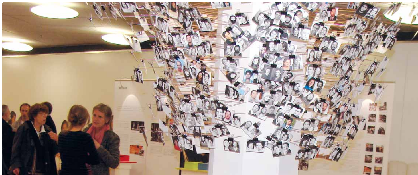
Exposition: l'arbre de mille volontaires