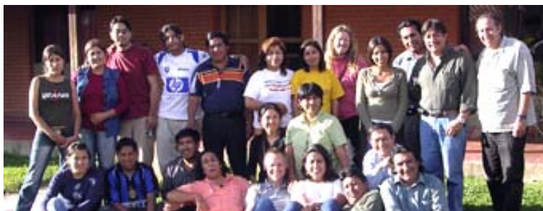
L'équipe de Kawsay au complet

Consolider le projet d'Université Interculturelle Indigène Kawsay (UNIK) en promouvant une nouvelle méthodologie éducative se basant sur les logiques des peuples indigènes . Il répond à la nécessité de valoriser leurs propres savoirs, leurs arts, leurs technologies et autres connaissances sans pour autant nier les apports de la modernité, mais plutôt construire le présent et le futur avec identité.