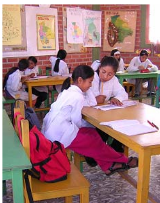
Des élèves qui bénéficient d'un environnement agréable