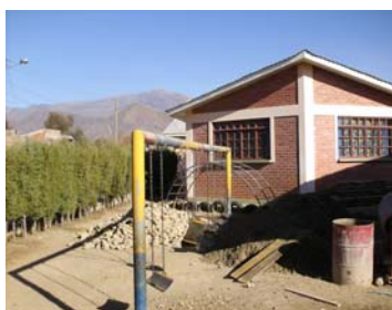
Des bâtiments en dur