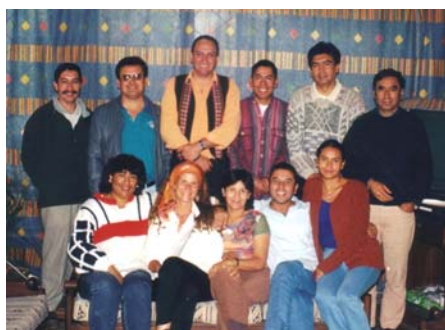
L'équipe de l'IDH