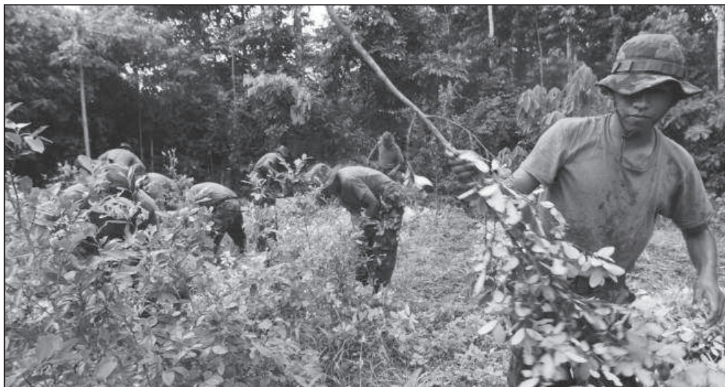
Des soldats et des conscrits démantèlent une parcelle de coca. L'Etat bolivien a annoncé avoir éradiqué 10 000 hectares de plantations illégales en 2011.