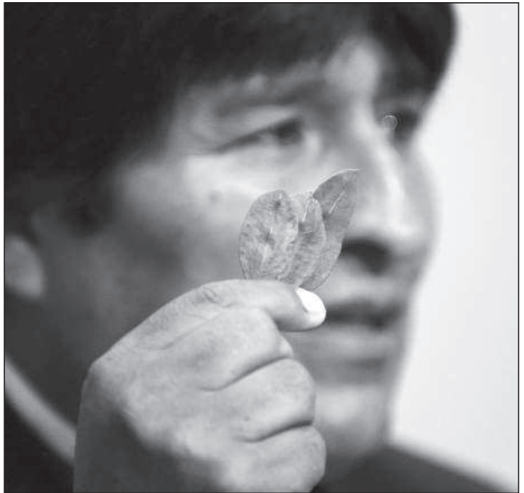
Le plus grand défenseur de la feuille de coca n'est autre que le président Evo Morales lui-même.

Depuis 1961, la feuille de coca se trouve en effet sur la liste des produits interdits par la Convention sur les stupéfiants de l'ONU. Sa production et sa consommation sont donc bannies. Avec une «coccasse» exception introduite par l'article 27, qui stipule que «les Parties peuvent permettre l'utilisation de feuilles de coca pour la préparation d'un produit aromatique». Lisez Coca Cola!